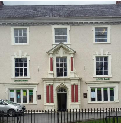
Banc hanesyddol Lloyds yn Llanymddyfri a gaeodd yn 2017.

Yng nghyfarfod Pwyllgor Eglwys a Chyfrifoldeb Cymdeithasol Undeb Bedyddwyr Cymru yn ddiweddar cafwyd trafodaeth mewn perthynas â niferoedd canghennau banciau sydd yn cau ar hyd a lled y wlad ac yn gadael rhai ardaloedd heb yr un fanc. Er bod Swyddfa'r Post yn cynnig gwasanaeth, nid ydynt yn cynnig yr ystod llawn o wasanaethau bancio. Mae modd bancio ar lein nid yw pawb yn medru gwneud hyn oherwydd diffyg gallu neu'r adnoddau. Ar ben hyn nid oes modd bancio ar lein yn y Gymraeg.