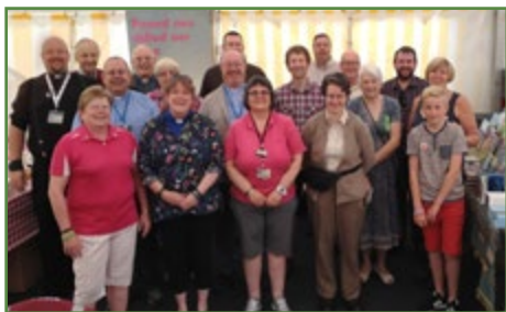
Gwirfoddolwyr y stondin 'Cytûn: Eglwysi Ynghyd' yn y Sioe, Llanellwedd, Gorffennaf 2016

Mae'r adroddiad hwn wedi cael ei baratoi yn ystod yr Adfent 2016, ac mae'n cynnig dathlu a myfyrio ar flwyddyn brysur arall yn gwasanaethu ein sefydliadau a'n heglwysi sy'n aelodau. Mae gwaith staff Cytûn yn cael ei ffurfio drwy lunio cynllun gwaith blynyddol. Bron yn ddiethriad, mae'r gwaith hwnnw y cytunwyd gan yr eglwysi, yn ystod y blynyddoedd diwethaf, wedi cael ei gyflwyno yn ei gyfanrwydd a'i gyflawni o fewn y gyllideb. Mae Cytûn bob amser yn ceisio ymateb i geisiadau oddi wrth yr eglwysi wrth i amgylchiadau a blaenoriaethau newid. Mae hynny wedi rhoi i offeryn eciwmenaid cenedlaethol Cymru y cyflymder i weithredu sydd wedi bod o fudd mawr i eglwysi unigol a'r teulu Cristnogol ehangach.