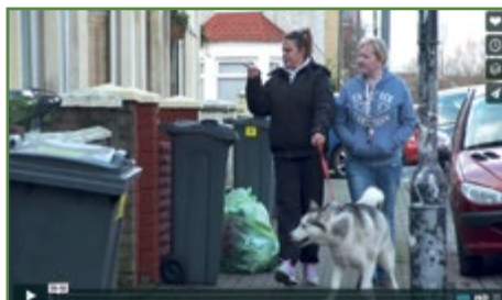
Clip fideo 'Tai a Thlodi' o wefan Cytûn, un o'r fideos a'r adnoddau a gynhyrchwyd ar gyfer Etholiad Cyffredinol Cymru

Mae galluogi'r eglwysi i ymateb yn briodol i ddyfodiad ceiswyr lloches a ffoaduriaid i Gymru wedi bod yn flaenoriaeth nodedig. Mae Cytûn hefyd wedi cadw ffocws parhaus yn y maes cyhoeddus ar heriau hirdymor ym mywyd cyhoeddus Cymru, gan gynnwys datblygu economaidd, addysg, iechyd, bywyd gwledig, cydlynad cymdeithasol a materion yn ymwneud â'r iaith Gymraeg. Parhawyd i gynnal y cyswllt gyda sefydliadau allweddol fel Ymddiriedolaeth Trussell. Yn aml, gofynnir i staff Cytûn fod yn siaradwyr allweddol mewn digwyddiadau, fel Diwrnod i Ffwrdd staff Cartrefi Cymunedol Gwynedd a gynhaliwyd ym Mhwlheli ym mis Gorffennaf.