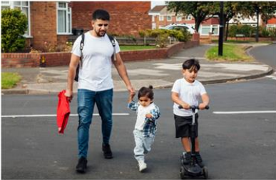
Cyd-ysgrifennwyd gan Ipsos a Trussell Trust (Ymddiriedolaeth Trussell)

Dyma enw dirdynol adroddiad am ymchwil newydd a gyhoeddwyd gan Ymddiriedolaeth Trussell . Mae un o bob pump o bobl yng Nghymru yn wynebu newyn, gyda phobl anabl, gofalgwyr, teuluoedd â phlant ifanc a rhieni seagl ymhlith y rhai sy'n wynebu'r risg uchaf.