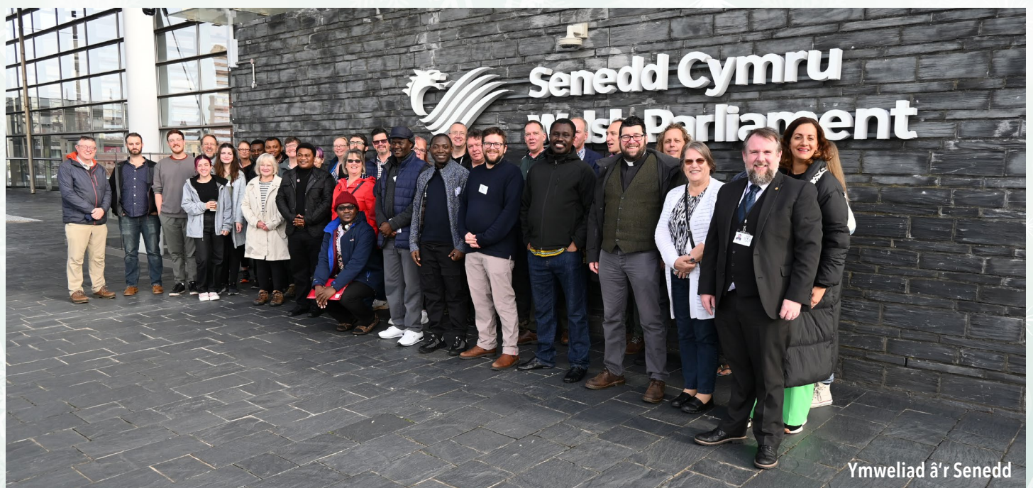
Ymweliad â'r Senedd